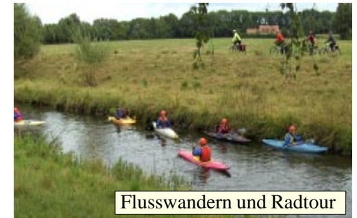
Flusswandern und Radtour